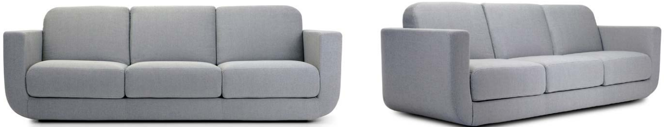
Nè divano 3 posti