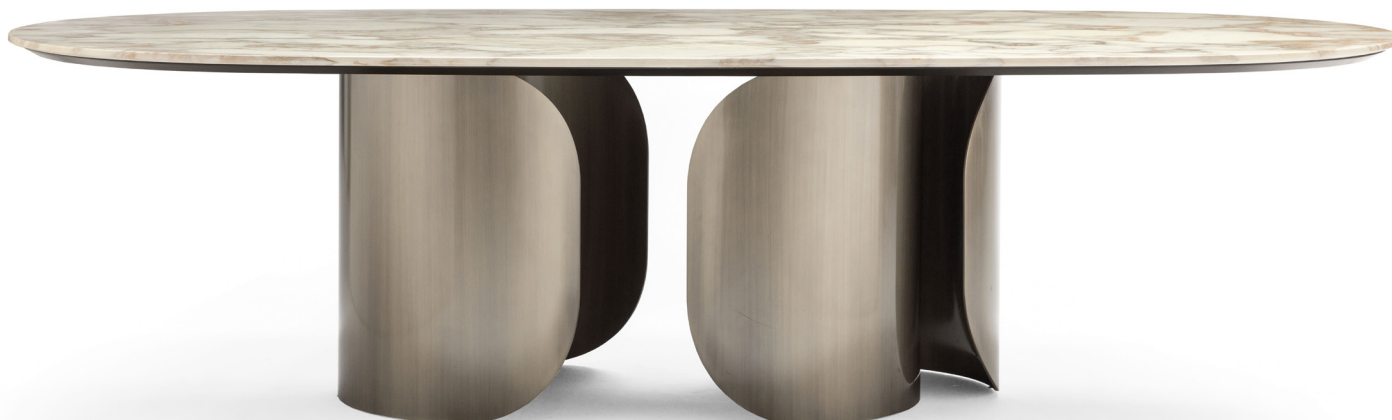
fin. MOS | Marble top CA - Gold Calacatta

“Protagonista della sala da pranzo firmata Opera Contemporary, Oscar è un elegante tavolo ovale caratterizzato da un vivace contrasto materico tra la base metallica e il piano in marmo. La struttura cilindrica arrotondata si apre su un lato per mostrare l'interno cavo. Questo arredo è disponibile con diverse dimensioni di piano.”