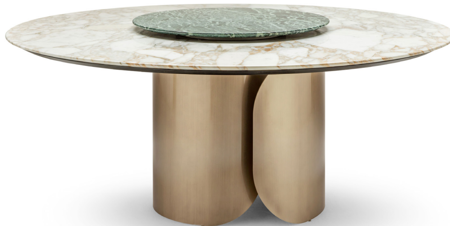
fin. MOS | Marble top CA - Gold Calacatta | Lazy Susan VAN - Natural Green Alps

“Protagonista della sala da pranzo firmata Opera Contemporary, Oscar è un elegante tavolo rotondo caratterizzato da un vivace contrasto materico tra la base metallica e il piano in marmo. La struttura cilindrica arrotondata si apre su un lato per mostrare l'interno cavo. Questo arredo è disponibile con diverse dimensioni di piano.”