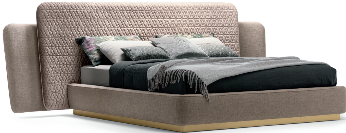
fin. VMS I TX 1039/3 Cat. A+TX 1022/33

“Nella zona notte una soluzione dai profili avvolgenti richiama l'attenzione; è il letto Sheila contraddistinto da una ricercata armonia cromatica e materica. Rigorosi principi estetici e funzionali dialogano con dettagli sartoriali preziosi; una trapuntatura a losanghe decora la testiera mentre il basamento rivela caldi accenti metallici. Questo arredo è disponibile in due dimensioni diverse.”