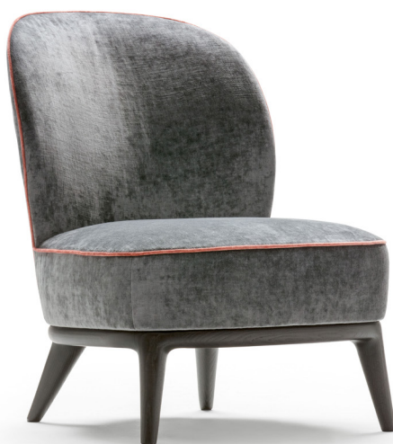
fin. EBA | TX 1022/31

“Nella poltrona Nicole dialogano linee aggraziate e dimensioni contenute, accentuate da un'accurata artigianalità. L'elegante e solida struttura lignea sostiene le soffici imbottiture della seduta e dello schienale che offrono una piacevole sensazione di accoglienza. L'approccio rigoroso della seduta racconta l'evoluzione del brand tra dettagli scenografici ed elementi dalla forte presenza grafica. Lo schienale può essere decorato da una trapuntatura a rombi sul retro. “