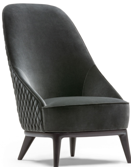
fin. EBA | TX 3027/31

“Una seduta confortevole e avvolgente, in cui coincidono proporzioni generose e linee sinuose. La seduta poggia su un'elegante base in legno laccato ebano dai profili levigati. Un pezzo dalla forte personalità in grado di coniugare comfort e ottima fattura artigianale. Lo schienale alto rivestito in tessuto può essere decorato da una trapuntatura a rombi sul retro. “