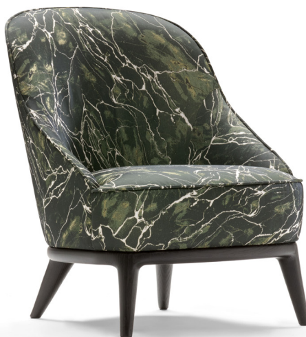
fin. EBA | TX 5821/5

“Caratterizzata da uno schienale avvolgente dai profili sinuosi, la poltrona Sally vanta una confortevole seduta imbottita priva di spigoli. La base in legno laccato ebano sorregge con eleganza le proporzioni calibrate della scocca, perfette per momenti conviviali indimenticabili sia all'interno degli spazi domestici, sia negli spazi pubblici. Lo schienale può essere decorato da una trapuntatura a rombi sul retro. “