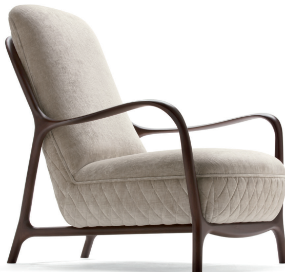
fin. WEN | TX 1022/13

“Tratti leggeri e profili sinuosi si incontrano nella poltrona Callas, un'elegante proposta scandita da una struttura in legno massello - completamente ingegnerizzata e rifinita a mano - che riflette il potenziale tecnologico raggiunto dal brand e rievoca la ricercata essenzialità del design scandinavo. Il rivestimento in tessuto può essere decorato da una trapuntatura a rombi sul retro. “