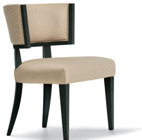
fin. EBA | TX 3024/2

Opera Contemporary | Design: Ufficio Tecnico