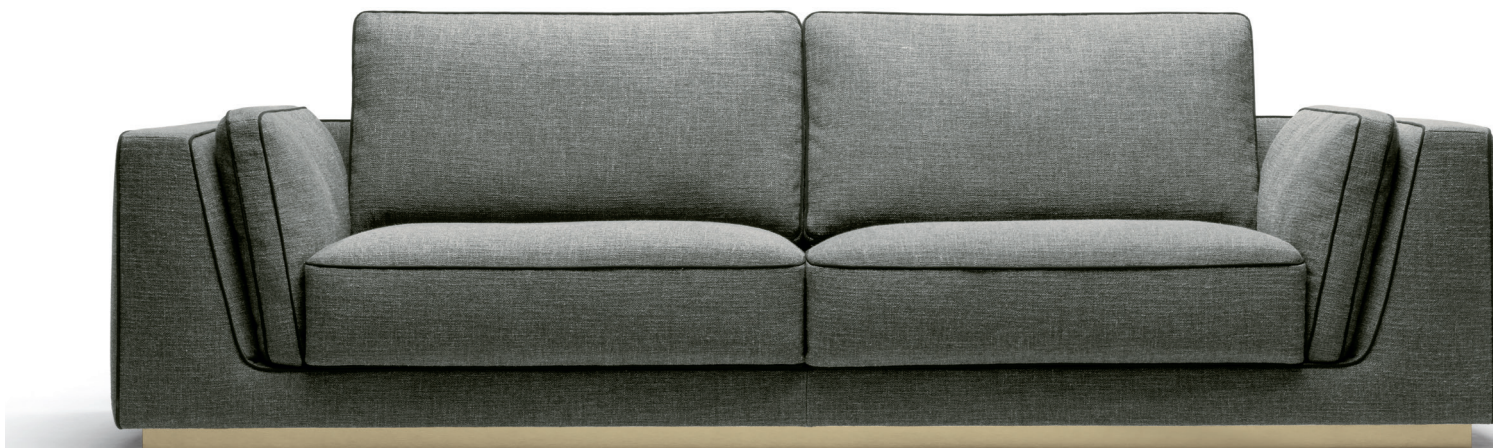
fin. VMS | TX 1039/27

L'elegante versatilità del divano Barry a tre posti – ispirato da un segno minimalista e rigoroso – è accentuata da profili essenziali e marcatamente orizzontali che poggiano su una struttura a terra, illuminata da una raffinata finitura metallica. La collezione include un divano a due posti.