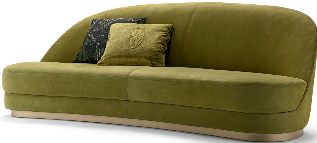
fin. VMS | PX 9920

“Il divano Kathy a tre posti è contraddistinto da profili organici e ricercati che dialogano con proporzioni equilibrate e compatte. L'essenzialità della seduta è contrastata da un dettaglio prezioso: la finitura metallica della base illumina e riscalda la rigidità della proposta. La collezione include un divano a due posti.”