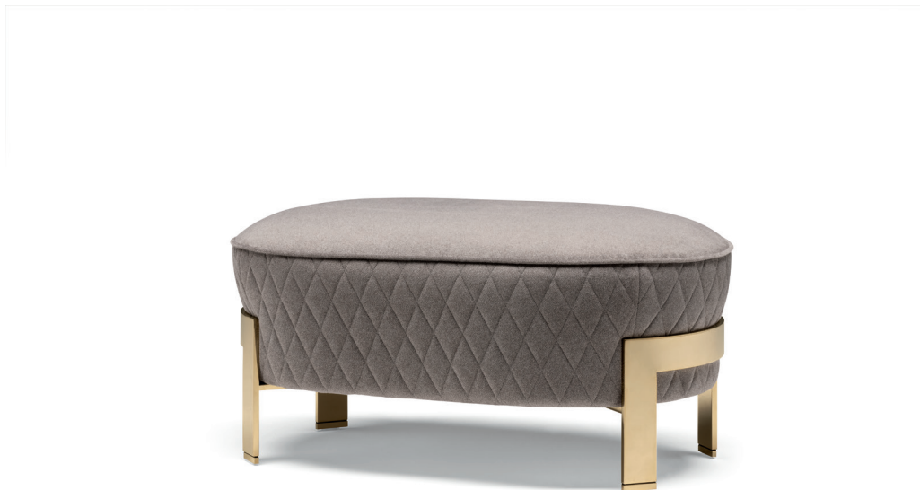
fin. MOB I PX 0114/33

“Appartiene alla famiglia di sedute Cosmo un pouf dalle forme rotonde contraddistinto da una leggera trapuntatura a losanghe e una struttura metallica essenziali. Cosmo è una soluzione versatile che può essere accostata ad altri elementi. Questo complemento è disponibile anche in versione senza trapuntatura a losanghe.”