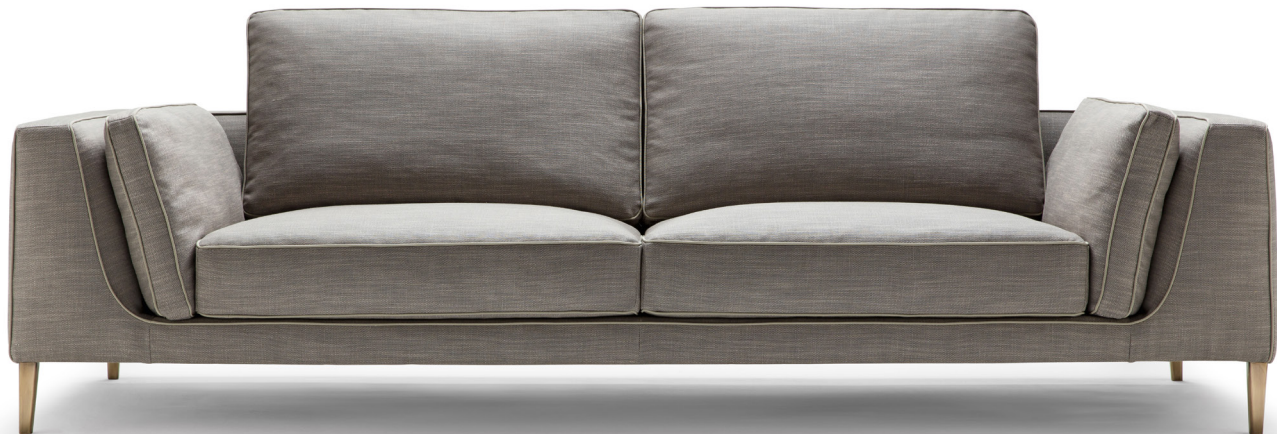
fin. MOS I TX 3023/11

“Il divano Ferdinand (a tre posti) esplora, attraverso il segno contemporaneo e duttile dei suoi moduli imbottiti, un'elegante essenzialità. I profili lineari poggiano su esili piedini metallici, un dettaglio raffinato che esalta i volumi proporzionali. La collezione include un divano a due posti.”