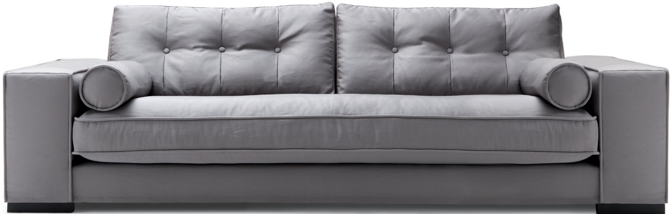
fin. EBA | TX 3021/11

Tratti moderni ed essenziali contraddistinguono il divano Mavra a tre posti, una soluzione funzionale e versatile, disponibile in diverse dimensioni, decorato da ricercate impunture - preziosi elementi di richiamo visivo e tattile - sui cuscini dello schienale. I piedini in legno di faggio sono disponibili in diverse finiture e i tessuti impiegati sono completamente personalizzabili. La collezione include un divano a due posti.