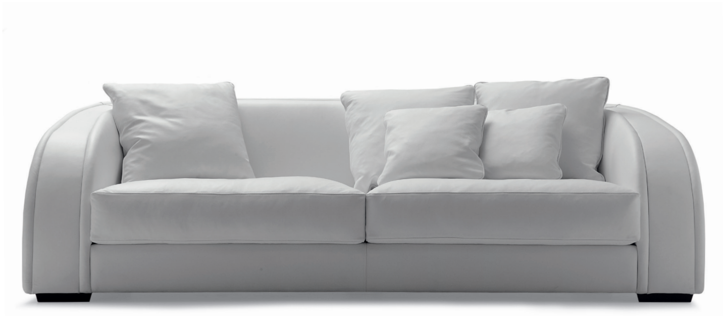
fin. EBA | PX 201

Le forme morbide e lo stile contemporaneo di questo divano a tre posti donano un tocco di classe a qualsiasi ambiente. La linea Carmen è la reinterpretazione in chiave moderna dei codici della tradizione classica e testimonia la grande esperienza dell'azienda nella realizzazione di proposte uniche e affascinanti. Particolare attenzione è stata posta nella relazione tra schienale e braccioli che si incontrano armoniosamente in un sottile gioco di equilibri esaltati dal rivestimento in pelle. La collezione include un divano a due posti.