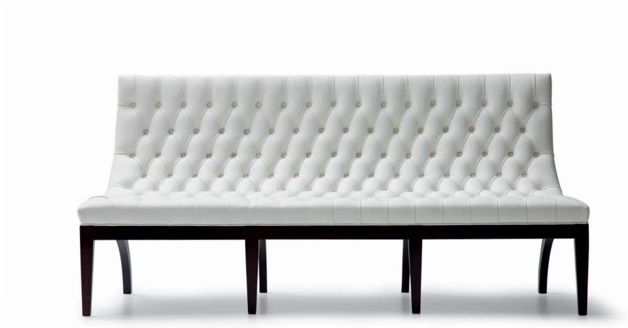
fin. WEN | PX 201

Un armonioso connubio tra linee essenziali e dettagli ricercati caratterizza il divano Antony a tre posti, una proposta dalle dimensioni compatte e i connotati decisi. Schienale e seduta sono rappresentati da un unico elemento imbottito – dolcemente inclinato – esaltato dal rivestimento in pelle e dalla lavorazione capitonnè. La collezione include un divano a due posti.