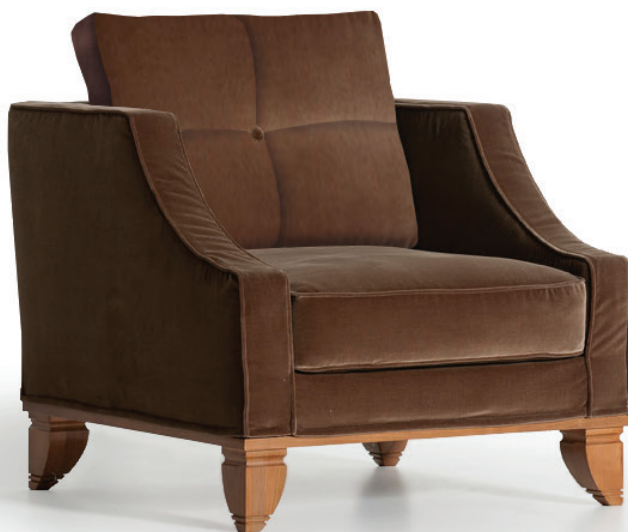
fin. NCA | TX 3027/15

Opera Contemporary | Design: Ufficio Tecnico