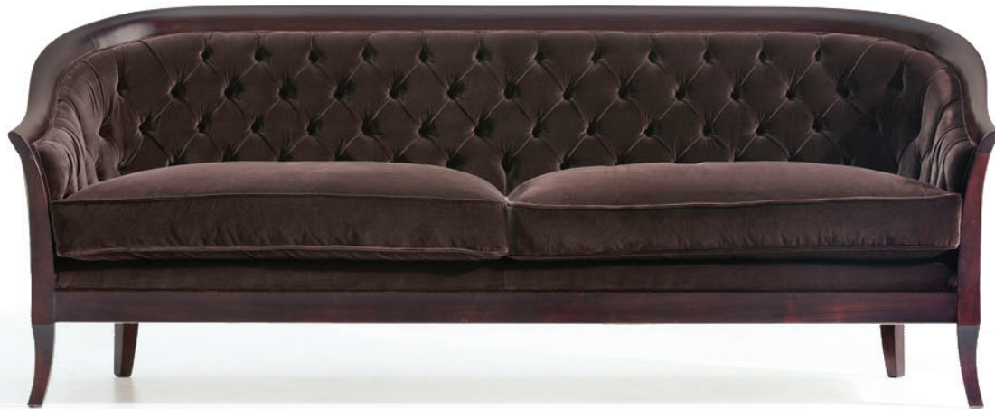
fin. EBA | TX 3027/37

Opera Contemporary | Design: Ufficio Tecnico